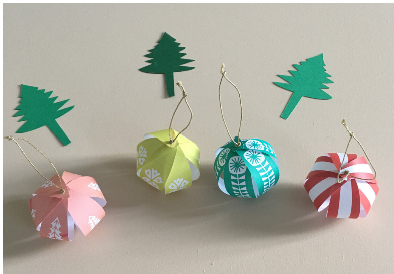
7- Réaliser un autre noeud à l'extrémité de la ficelle de façon à créer une boucle qui permettra de suspendre la boule de Noël.